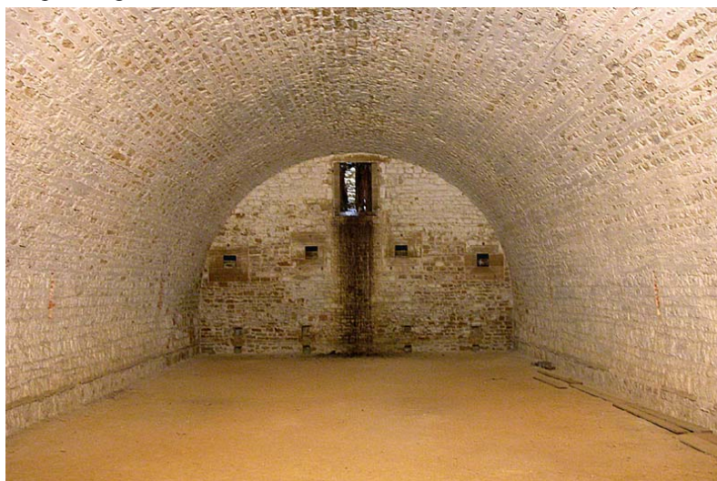
Forme des salles

Chaque régiment se verra attribuer une à deux salles dans l'allée principale du fort afin de s'installer. Vous serez donc au sec en cas d'intempérie. Chaque salle est munie d'une cheminée, mais nous n'avons pas l'assurance qu'elles ne seront pas bouchées lors de notre arrivée. Nous vous demandons donc de ne pas les utiliser lors de l'événement afin d'éviter tout incident. Les feux ne sont pas autorisés en dehors de ceux gérés par l'organisation.